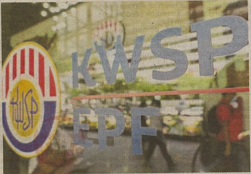
Pencarum KWSP dijangka menerima lebih 5.8 peratus dividen bagi simpanan konvensional tahun lalu.

Bagi sembilan bulan pertama tahun lalu, KWSP turut mencatatkan pendapatan RM57.57 bilion iaitu