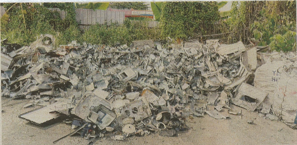
ANTARA sisa elektronik yang dirampas dalam serbuan di sebuah premis di Jalan Kapar, Klang kelmarin.