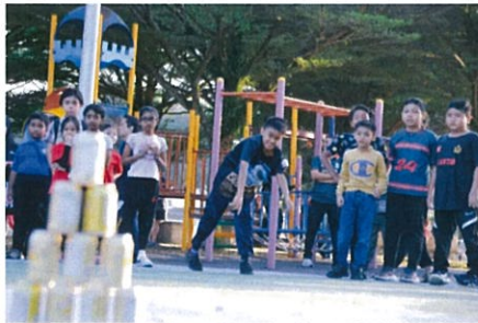
Orang ramai menyertai sukan rakyat pada Program Hari Tanpa Kenderaan Subang Jaya (HTKSJ) 2025 di Taman Tasik Sri Serdang pada 8 Februari 2025.