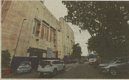
Illegally parked cars at Jalan Jambu in Kepong.

"There is no conclusion date for the construction," Yee said, referring to the development notice at the site.