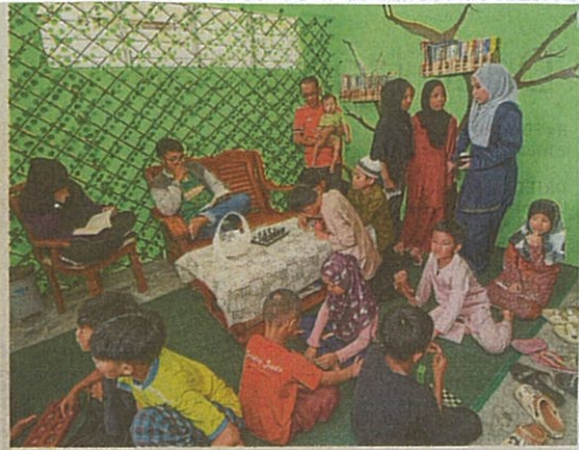
PPR Kampung Muhibbah residents gathering at a beautified lift lobby on one of the floors in Block A.