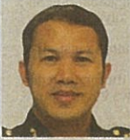
Pengarah Bahagian Pemantauan dan Penyelarasan Suruhanjaya Pencegahan Rasuah Malaysia (SPRM)

• Komitmen semua jentera kerajaan dalam menggerakkan Strategi Antirasuah Nasional 2024-2028 (NACS 2024-2028) pasti boleh meningkatkan prestasi CPI Malaysia