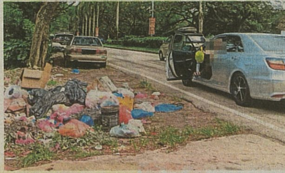
MASIH ada penduduk yang membuang sampah dekat Jalan Persiaran Bumi Hijau walaupun CCTV sudah dipasang.