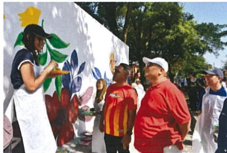
Lakukan mural di Tasik Sri Serdang pada Program Hari Tanpa Kenderaan Subang Jaya (HTKSJ) 2025 di Taman Tasik Sri Serdang pada 8 Februari 2025.

Majlis Bandaraya Subang Jaya (MBSJ) di Facebook berkata kerjasama dengan Universiti Putra Malaysia (UPM) menjadikan edisi pertama HTKSJ tahun ini berlangsung lebih meriah.