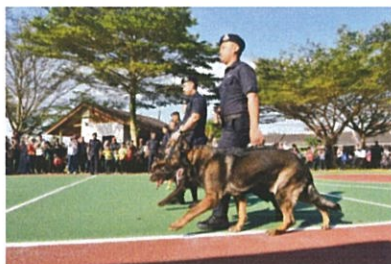
Pertunjukan Anjing Pengesanan K9 pada Program Hari Tanpa Kenderaan Subang Jaya (HTKSJ) 2025 di Taman Tasik Sri Serdang pada 8 Februari 2025.

"Tahniah kepada pemenang cabutan bertuah dan teruskan sokongan anda dan jumpa lagi di #HTKSJ bulan Mei nanti!" katanya.