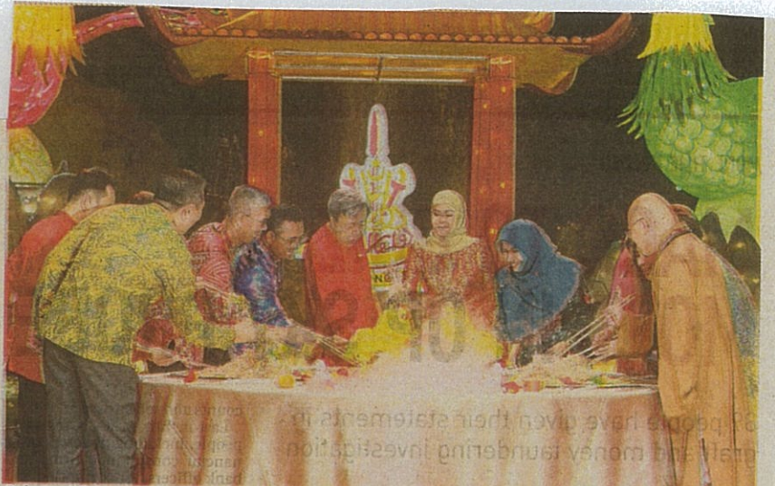
Sultan of Selangor Sultan Sharafuddin Idris Shah tossing 'yee sang' at the Fo Guang Shan Dong Zen Temple in Jenjarom on Saturday. With him are Tengku Permaisuri Norashikin (sixth from left) and Selangor Menteri Besar Datuk Seri Amirudin Shari (fourth from left).

They then toured the lantern festival and flower exhibition at the temple grounds before departing. Bernama