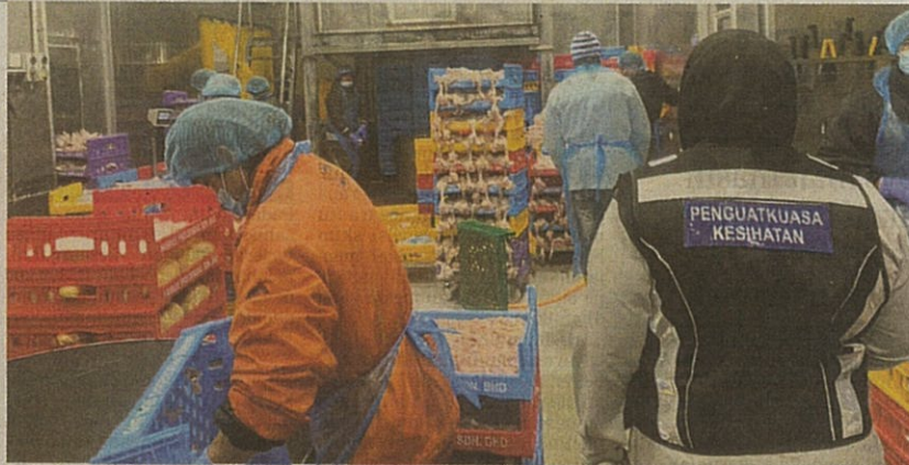
Pengkuat kuasa DBKL memeriksa kilang sembelih dan memproses ayam dalam operasi di Kuala Lumpur.

"Empat premis diperiksa dan hasil pemeriksaan mendapati lantai, dinding dan tahap kebersihan premis dalam keadaan tidak memuaskan di premis pertama.