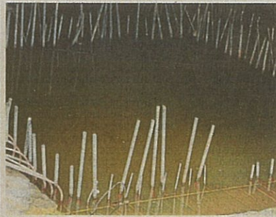
A pool of stagnant water raises concerns that the area can turn into a breeding ground for Aedes mosquitoes.

ing the mall or eating at stalls along Jalan Jambu often chose to park illegally by the road.