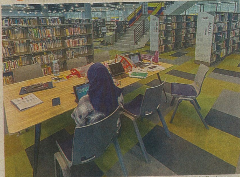
Ghazali said many assume public libraries are outdated without seeing the improvements, adding that libraries are strategic agents for community development.

that libraries must go fully digital, stressing that hybrid ones that blend traditional resources with modern technology are the way forward.