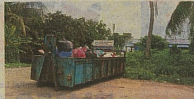
TONG sampah besar tidak mampu tampung keseluruhan penduduk.

"Ada juga orang luar yang ambil kesempatan membuang sampah terutama pada waktu malam, keluar