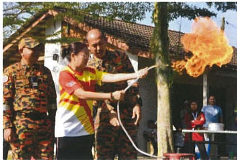
Pertunjukkan cara pemadaman kebakaran kecil oleh pihak bomba pada Program Hari Tanpa Kenderaan Subang Jaya (HTKSJ) 2025 di Taman Tasik Sri Serdang pada 8 Februari 2025.

"Pelbagai aktiviti menarik seperti fiesta sarapan pagi, pemeriksaan kesihatan percuma, Eco Free Market, Sukan Rakyat Tradisional & Explorace "Kenali & Hapus Denggi."