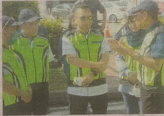
Nik Nazmi (tengah) hadir di Majlis Perasmian Operasi Gerak Kenderaan Bermotor Peringkat Kebangsaan di Lebuhraya Shah Alam pada Rabu.

SHAH ALAM - Malaysia akan mula melaksanakan penggunaan petrol Euro 5 pada September 2025 dan dijangka mencapai spesifikasi penuh pada 2027 sebagai langkah penyelesaian jangka panjang dalam menjaga kualiti udara negara.