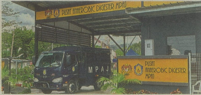
MPAJ's anaerobic digester plant at Jalan Kolam Ayer Lama processes food waste into liquid fertiliser and biogas.

Local council to add 10 pick-up locations following success of its anaerobic digester plant