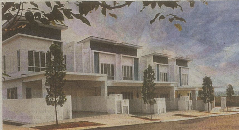
HARGA rumah teres dijangka meningkat sehingga lima peratus menjelang tahun depan ekoran permintaan yang tinggi. - GAMBAR HIASAN

Jelas beliau, secara amnya, rumah teres adalah antara jenis