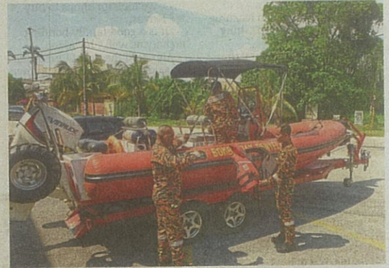
Port Klang Fire and Rescue Station personnel checking the life jackets and inflatable amphibious boat which are to be used in the event of floods.

Andry encouraged residents to prepare themselves by keeping documents and essential items in an emergency bag.