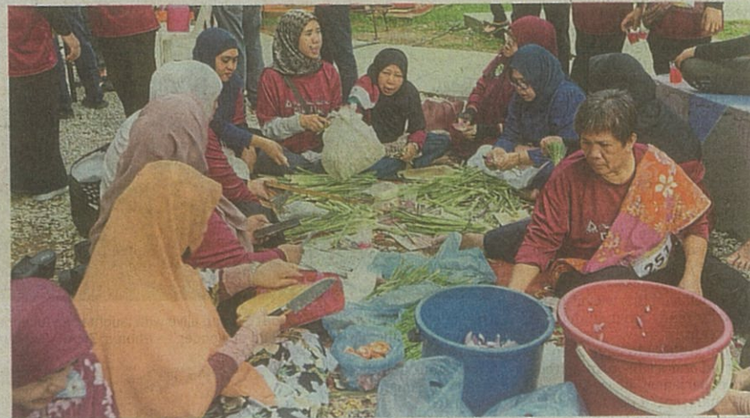
Residents volunteering their time to cook dinner for 3,000 people.

Plan to involve all 12 local authorities in next year's slate of strata community events