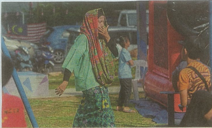
A participant clad in sarong as part of activities at the PPR Kota Damansara Rewang Komuniti Strata programme.